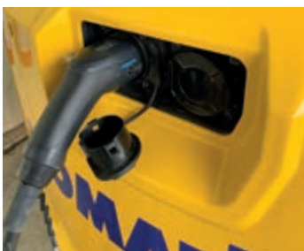
Integriertes 230 V Wechselstromladegerät