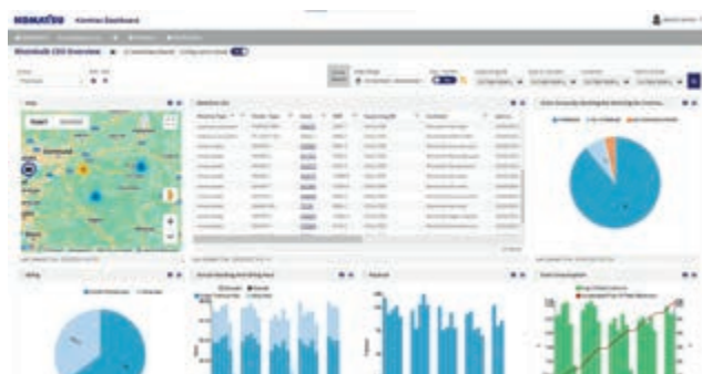
Modello di visualizzazione della visione d'insieme per il CEO