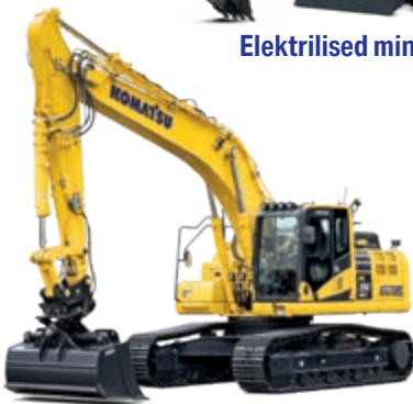
Hüdraulilised ekskavaatorid ja buldooseriid nutika juhtimistarkvaraga 2.0