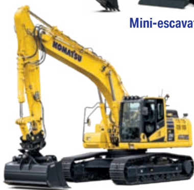
Escavatori idraulici e dozer equipaggiati con intelligent Machine Control 2.0