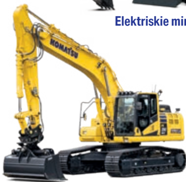
Hidrauliskie ekskavatori un buldozeri ar inteligēnto mašīnas vadību 2.0