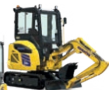
Elektriskie mini ekskavatori