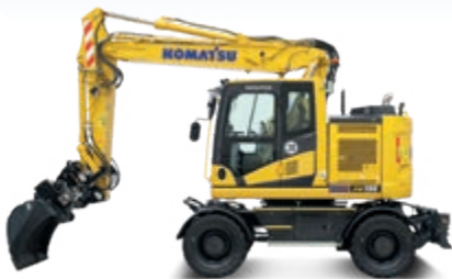
Riteņu šasijas ekskavatori