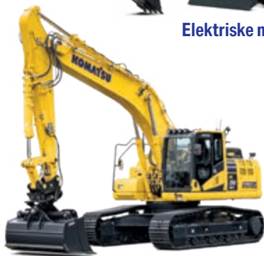
Beltegravere og dosere med intelligent maskinstyring 2.0