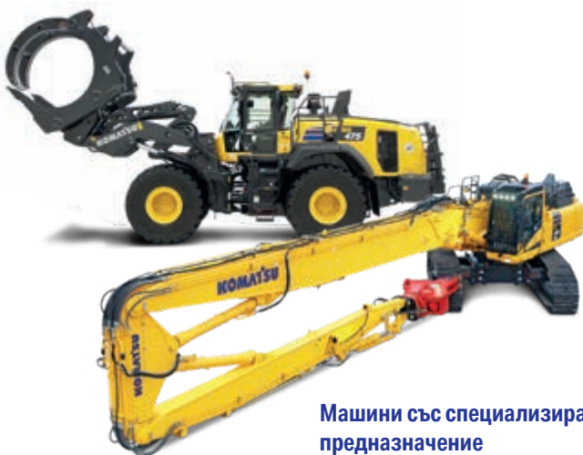
Машини със специализирано предназначение