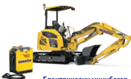
Електрически минибагер PC33E-6