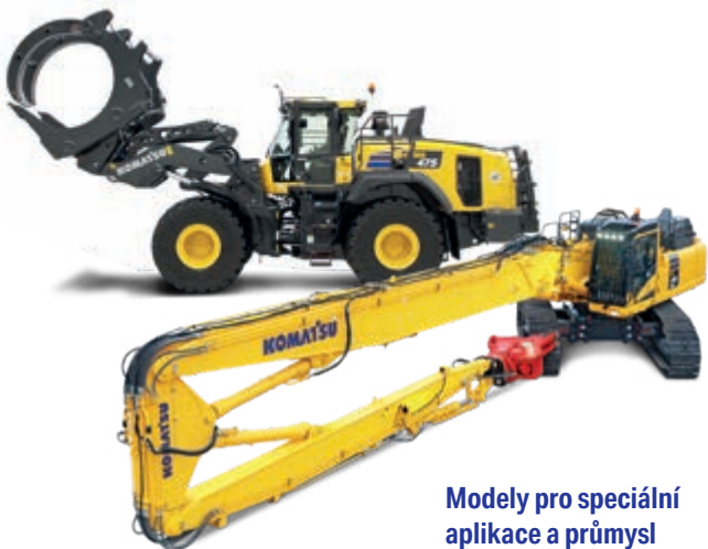
Modely pro speciální aplikace a průmysl