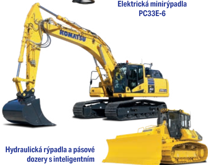
Hydraulická rýpadla a pásové dozery s inteligentním ovládáním stroje 2.0