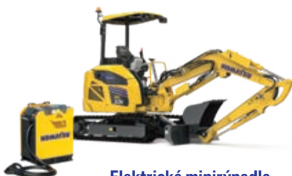
Elektrická minirýpadla PC33E-6