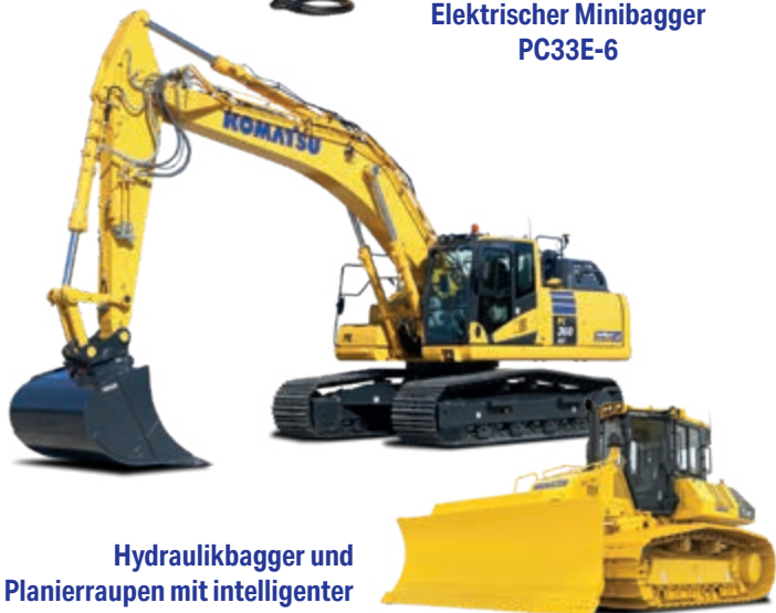
Hydraulikbagger und Planiererraupen mit intelligenter Maschinensteuerung 2.0