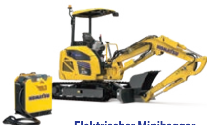
Elektrischer Minibagger PC33E-6