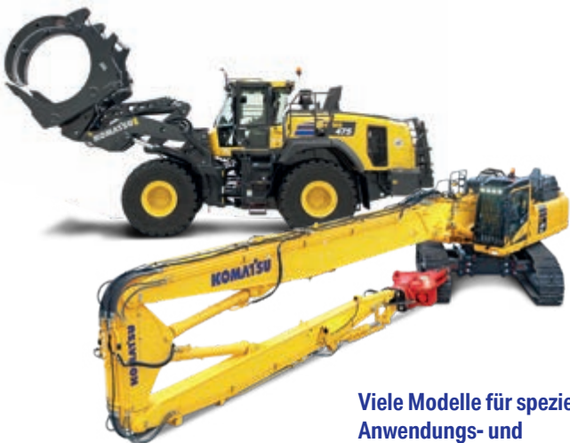
Viele Modelle für spezielle Anwendungs- und Industrieinsätze