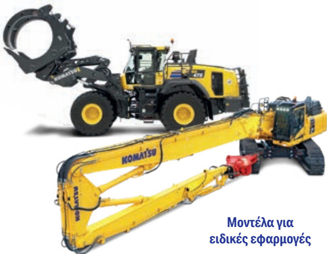
Μοντέλα για ειδικές εφαρμογές