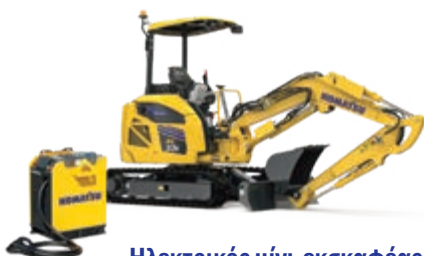
Ηλεκτρικός μίνι-εκσκαφέας PC33E-6