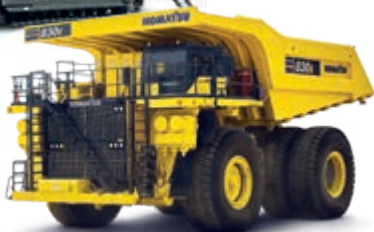
Ηλεκτρικά ανατρεπόμενα φορτηγά