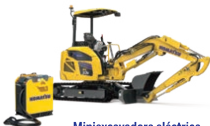
Miniexcavadora eléctrica PC33E-6