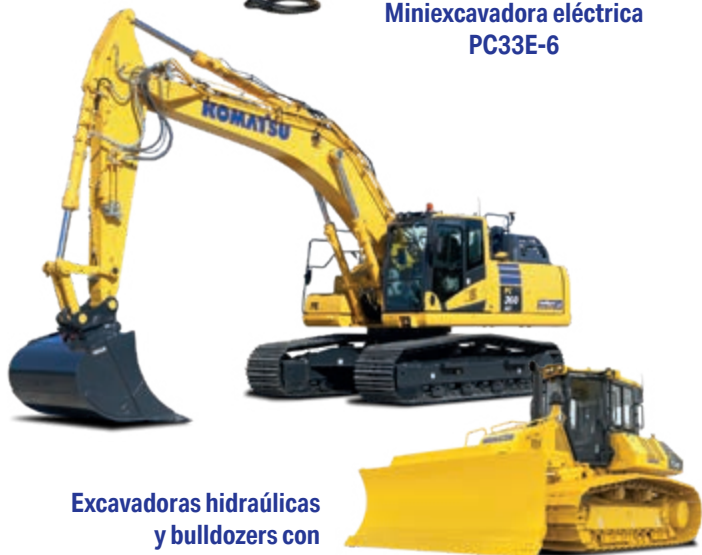
Excavadoras hidráulicas y bulldozers con Control Inteligente 2.0