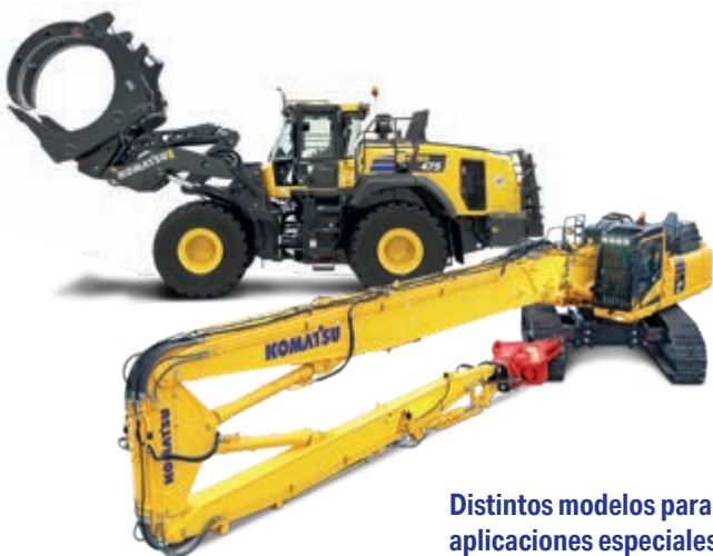
Distintos modelos para aplicaciones especiales