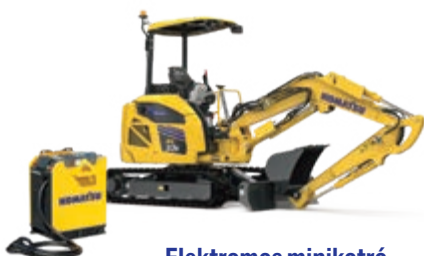
Elektromos minikotró PC33E-6