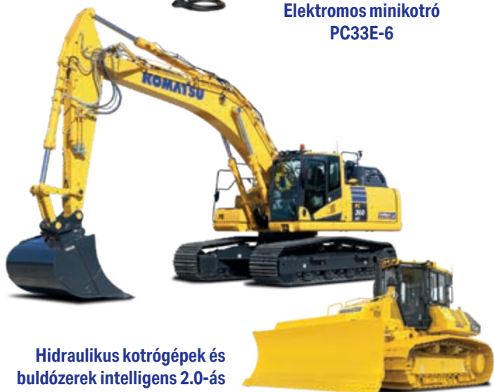
Hidraulikus kotrógépek és buldózerek intelligens 2.0-ás gépezérléssel