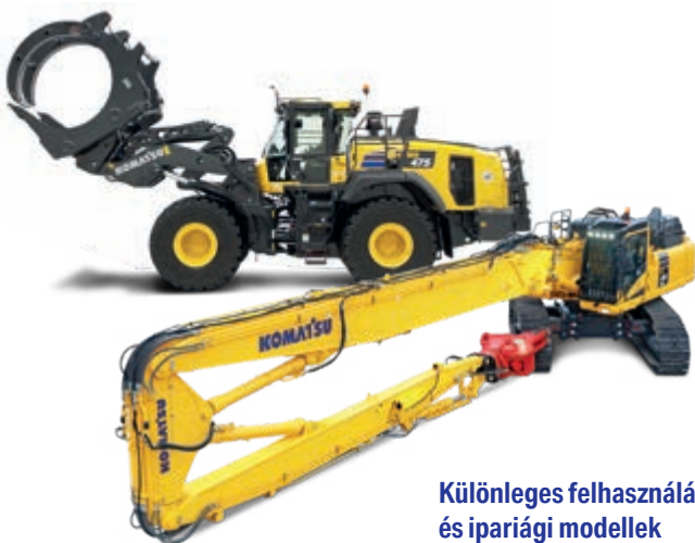
Különleges felhasználású és ipariági modellek