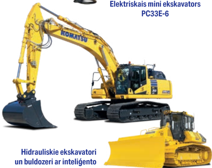
Hidrauliskie ekskavatori un buldozeri ar inteligento mašīnas vadību 2.0