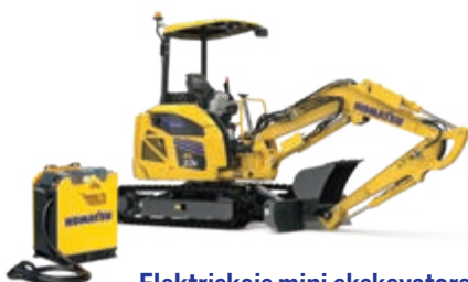
Elektriskais mini ekskavators PC33E-6