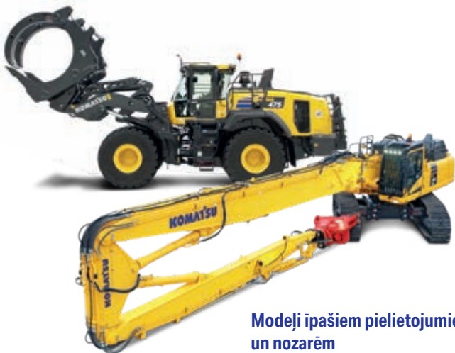
Modeļi īpašiem pielietojumiem un nozarēm