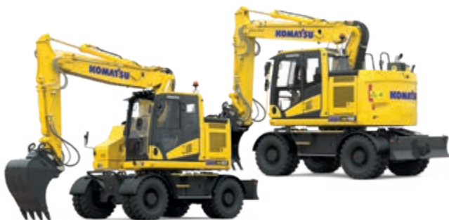
Riteņu šasijas ekskavatori PW168-11 & PW198-11