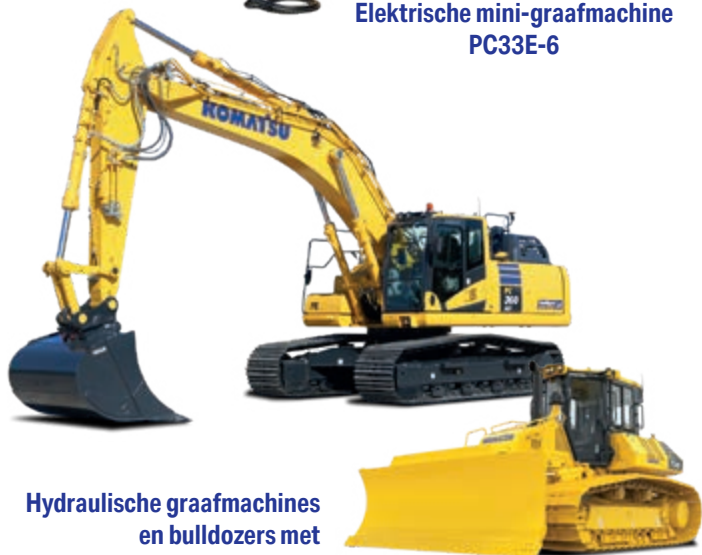
Hydraulische graafmachines en bulldozers met intelligent Machine Control 2.0