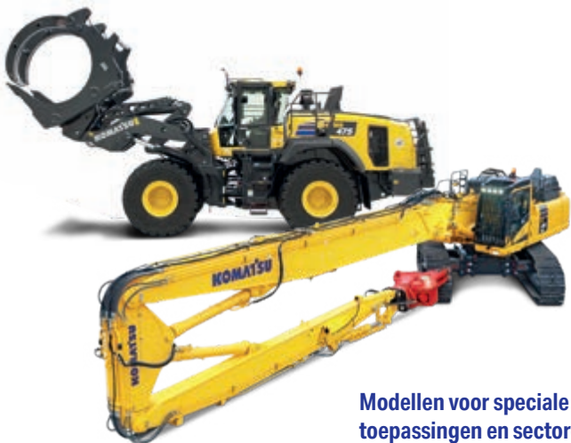
Modellen voor speciale toepassingen en sectoren