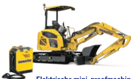
Elektrische mini-graafmachine PC33E-6