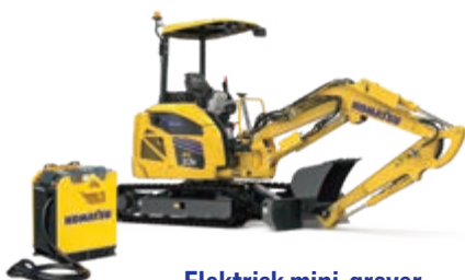
Elektrisk mini-graver PC33E-6