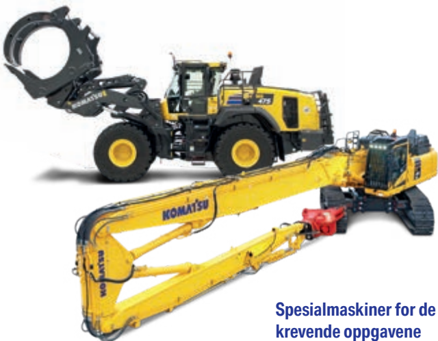
Spesialmaskiner for de krevende oppgavene