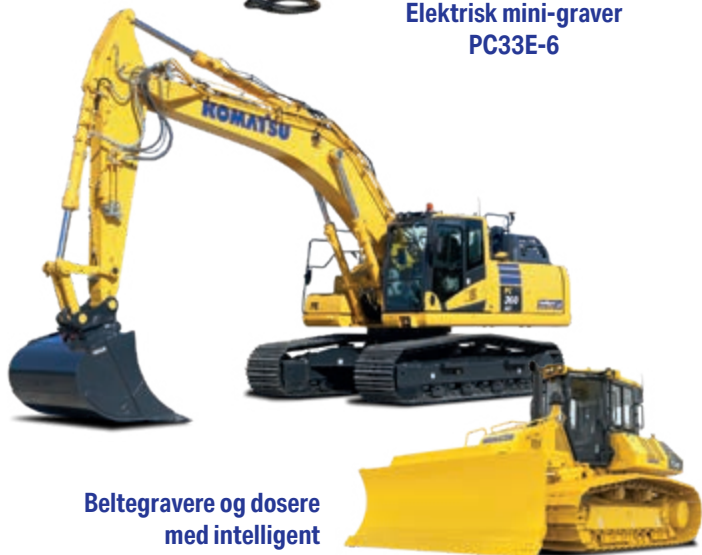
Beltegravere og dosere med intelligent maskinstyring 2.0