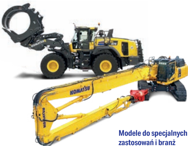
Modele do specjalnych zastosowań i branż