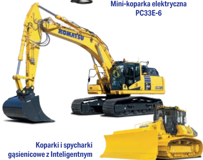
Koparki i spycharki gąsienicowe z Inteligentnym Sterowaniem maszyną 2.0