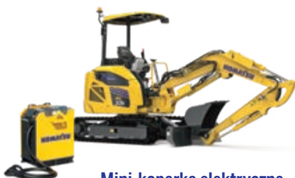
Mini-koparka elektryczna PC33E-6