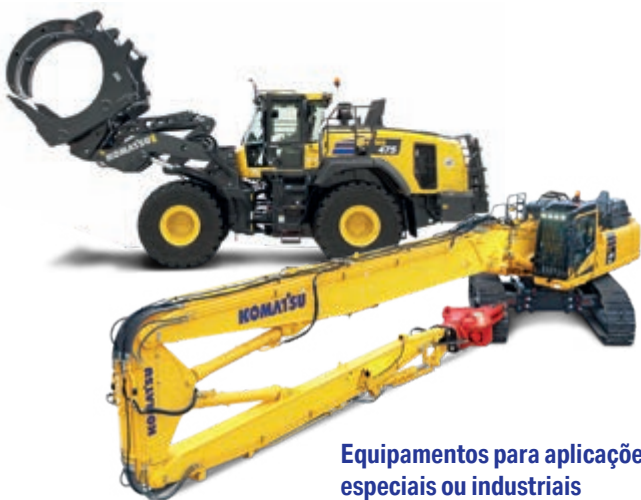
Equipamentos para aplicações especiais ou industriais