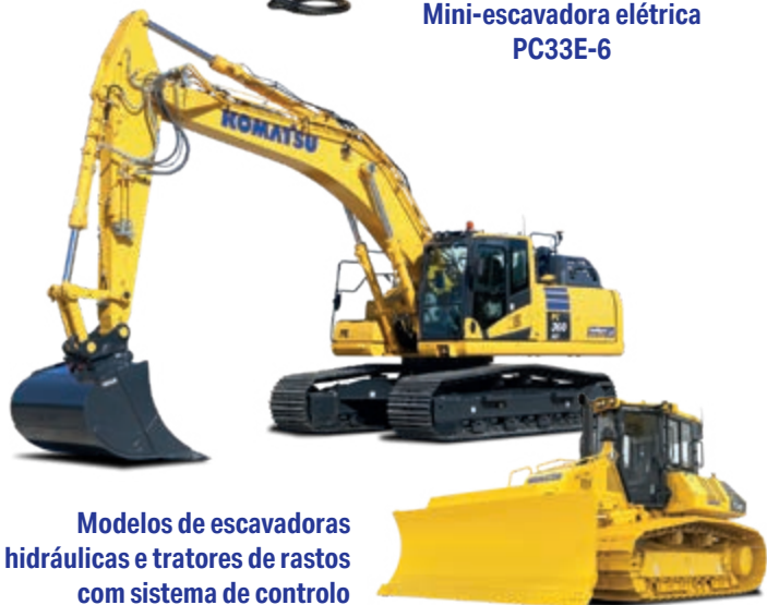
Modelos de escavadoras hidráulicas e tratores de rastos com sistema de controlo inteligente 2.0