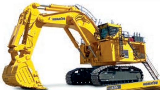
Escavadoras hidráulicas para minas