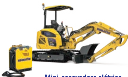
Mini-escavadora elétrica PC33E-6