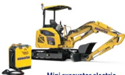
Mini excavator electric PC33E-6