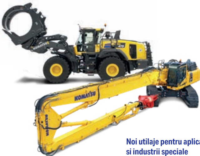
Noi utilaje pentru aplicatii si industrii speciale