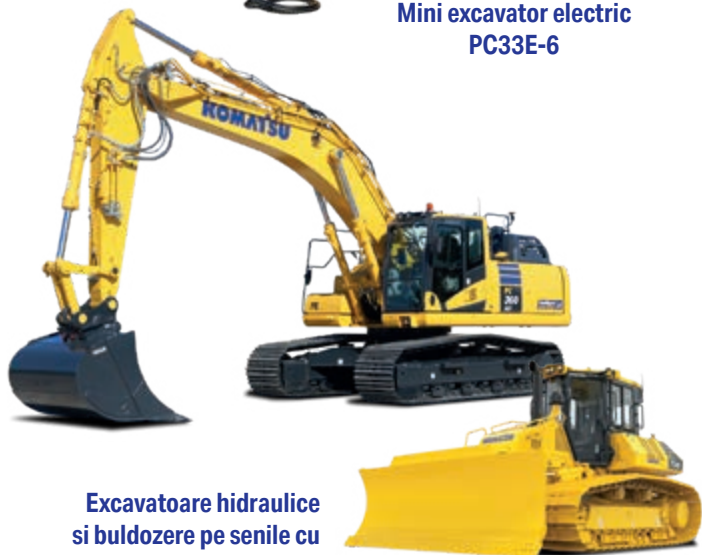
Excavatoare hidraulice si buldozere pe senile cu Control Inteligent 2.0