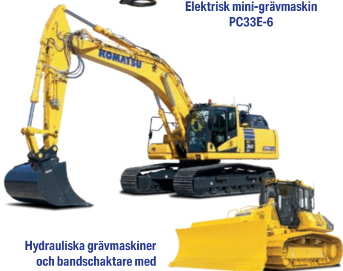
Hydrauliska grävmaskiner och bandschaktare med intelligent maskinstyrning 2.0