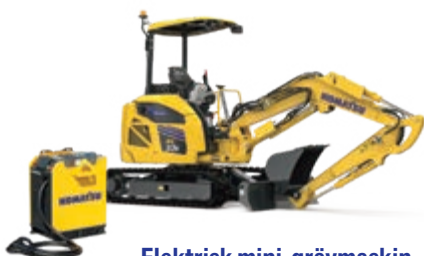
Elektrisk mini-grävmaskin PC33E-6