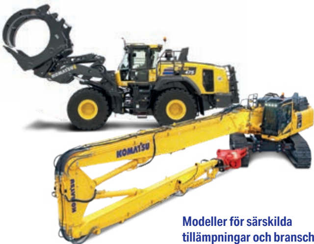
Modeller för särskilda tillämpningar och branscher