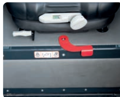
Blocage de sécurité des commandes de l'équipement de travail