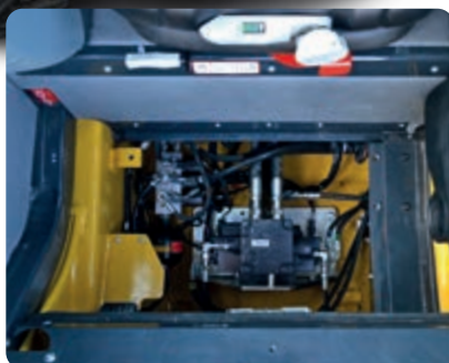
Grâce au capot interne de la cabine, l'entretien du distributeur hydraulique s'effectue rapidement sans basculer la cabine