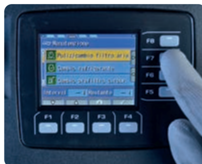
Ecran de maintenance affiché sur l'écran couleur de 3,5 pouces