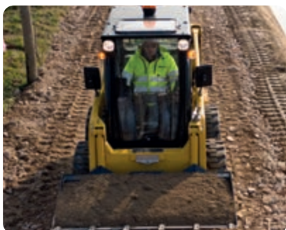
Excellente visibilité sur l'équipement de travail et le chantier