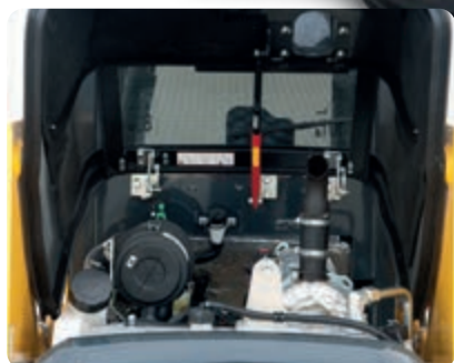
Accès facile aux points de maintenance quotidienne

La maintenance quotidienne et les contrôles de routine peuvent être réalisés en ouvrant très simplement le capot arrière. En outre, l'ouverture du capot arrière permet à l'utilisateur d'accéder aux radiateurs, qui peuvent être inclinés pour les nettoyer. Ensuite, pour les opérations de maintenance particulières, la cabine inclinable offre un accès complet à la transmission et aux principaux composants du système hydraulique. L'adoption de bagues auto-lubrifiantes spécifiques a permis d'augmenter l'intervalle de lubrification à 250 heures pour toutes les chargeuses.