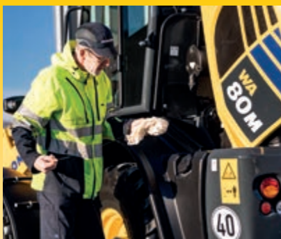
Schneller, einfacher und bequemer Zugang zu allen täglich zu wartenden Punkten