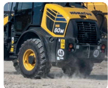
Schnellläuferversion mit 40 km/h hydrostatischem Antrieb (optional)