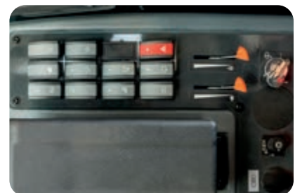
Optimierte, ergonomische Bedienelemente