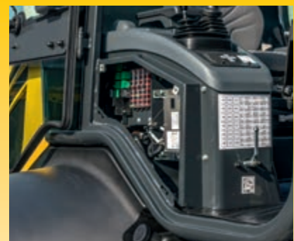
Seitliche Wartungsklappe für schnellen Wartungszugang