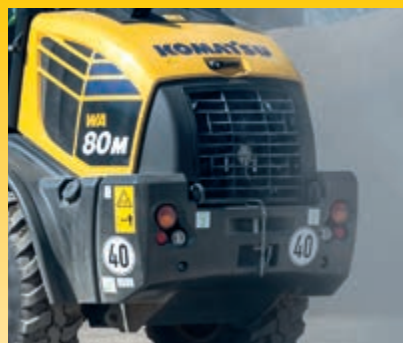
Grobmaschiger Kühler mit automatischem Umkehrlüfter (optional)