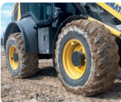
100% Differentialsperre, vorn und hinten (optional)