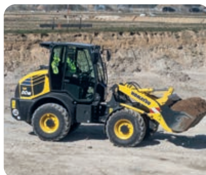
Elektronisch gesteuerter Laststabilisator (ECSS) (optional)