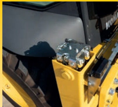
Valvole di sicurezza per stabilizzatori, braccio principale e avambraccio (di serie)